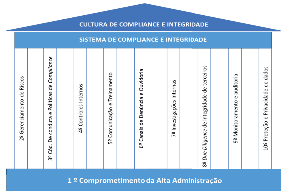
Figura 1 – Pilares de Programa de Compliance