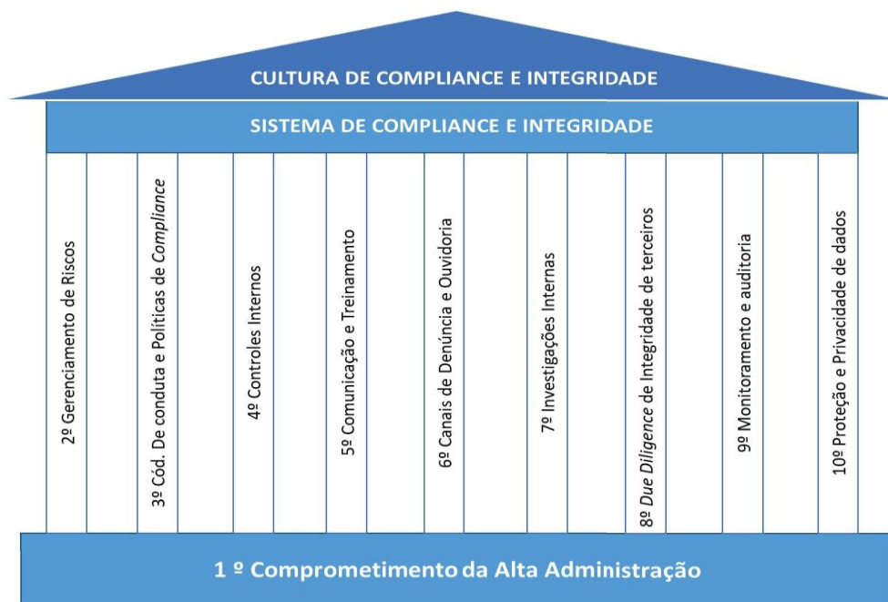
Figura 1 – Pilares de Programa de Compliance