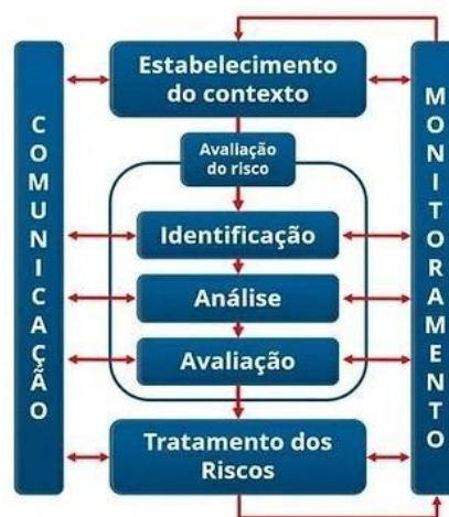
Figura 3 – Ciclo de Riscos

Com a utilização sistema de gerenciamento de riscos automatizado (Perinity-GRC) realizamos um trabalho de forma ágil e assertiva com as áreas mapeadas, transmitindo a metodologia do gerenciamento para a gestão e partes interessadas por meio do ciclo de avaliação de riscos realizado dentro da ferramenta: